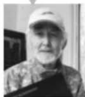
セルゲイ草柳 様 (写真家)